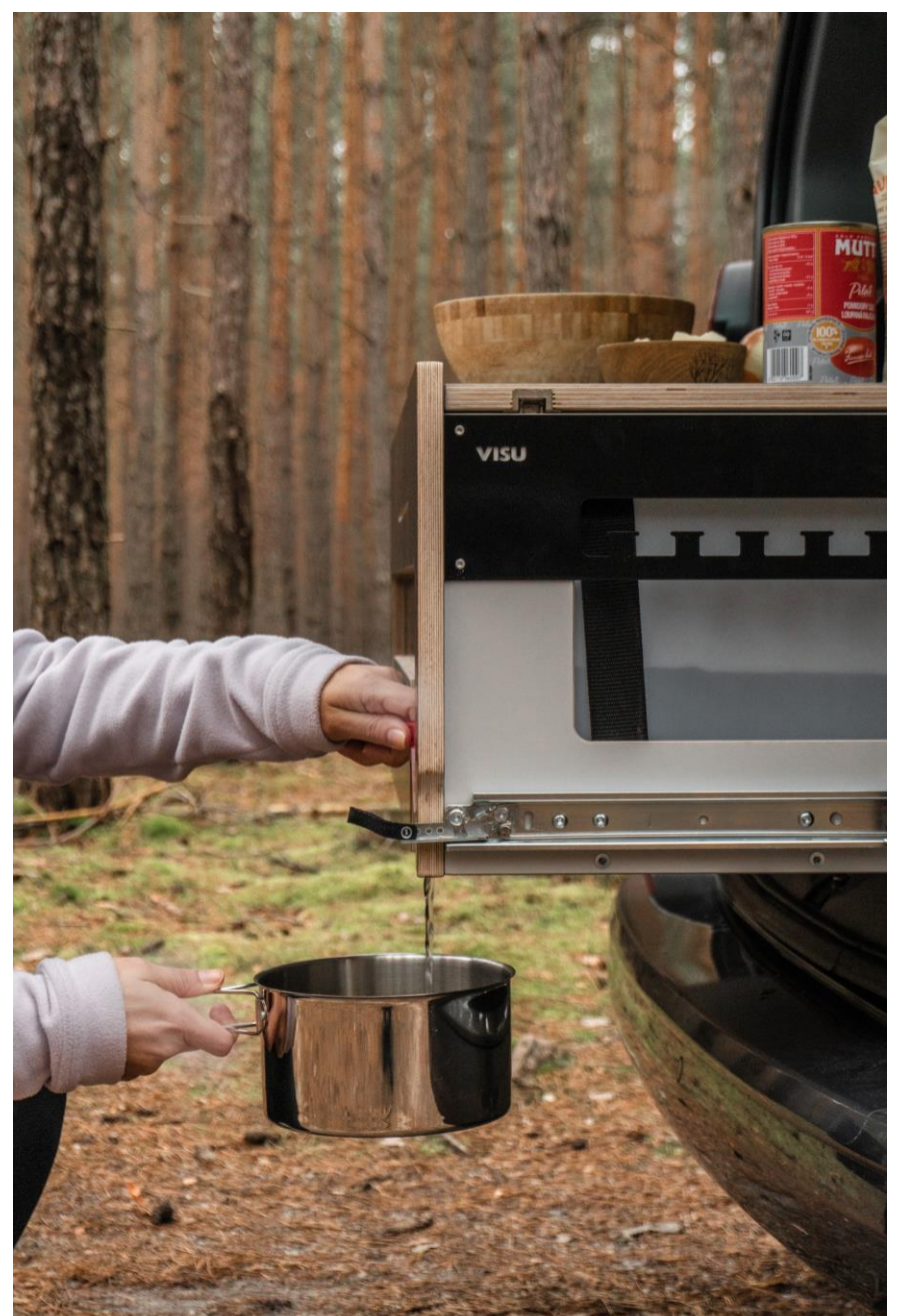
Bsp. VISU Moie