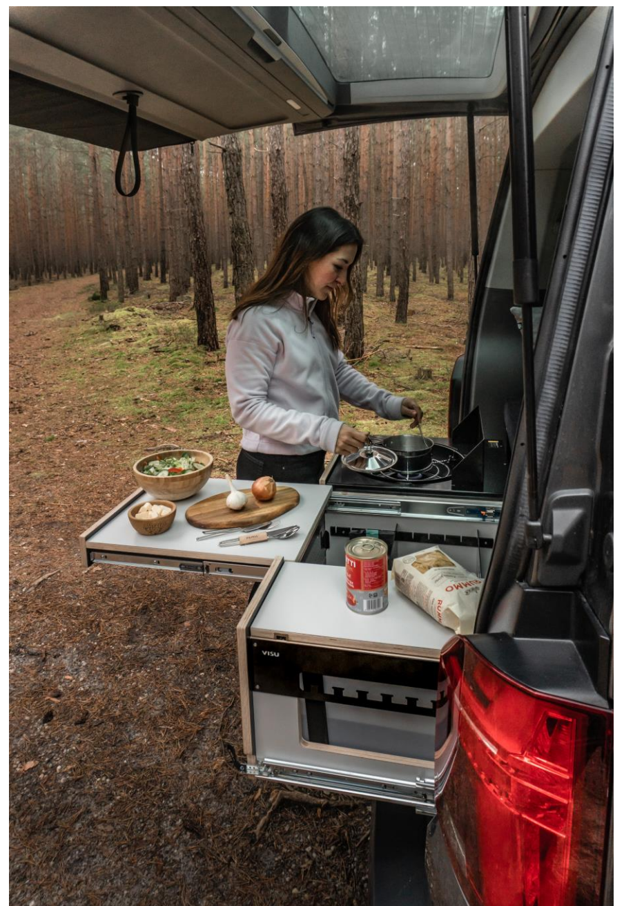
Bsp. VISU Moie