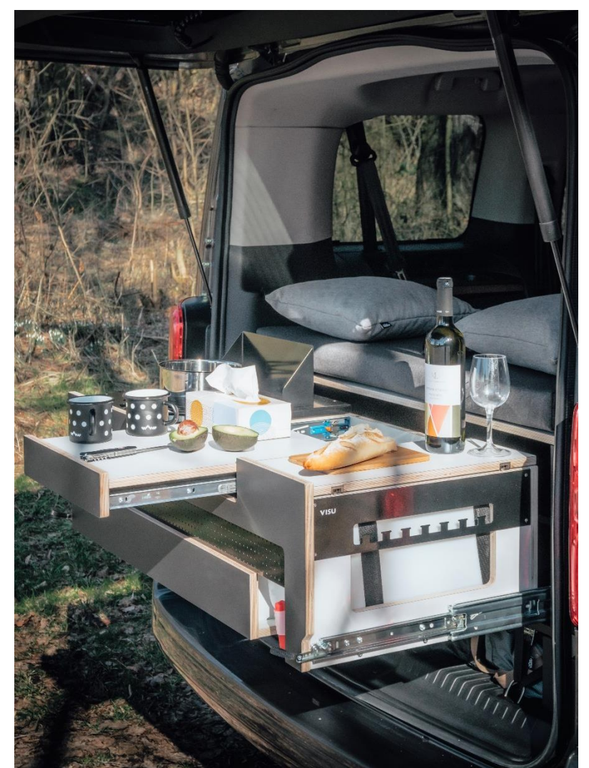
Bsp. VISU MoieBox