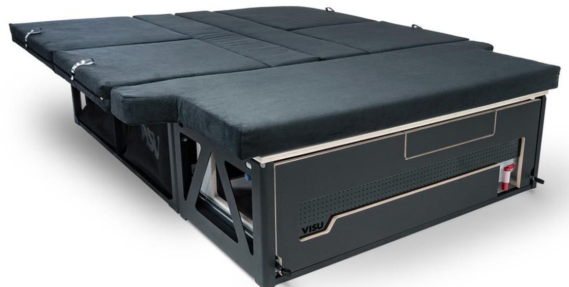
Bsp. VISU Moie

Die TrimFit™-Technologie bringt buchstäblich eine neue Dimension in die VISU-Familie. Sie ermöglicht es, noch mehr passgenaue Formen für die verschiedensten Fahrzeug-Innenräume zu entwickeln und die Lieferzeit dramatisch zu verkürzen. Die langlebigen Metallbleche werden in gefrästen Nuten im Sperrholz platziert und dienen als Träger für den Matratzenbereich. Wenn Sie in Zukunft ein neues Automodell kaufen, müssen Sie nur die Matratzen durch TrimFit™ ersetzen und das Modul kann Ihnen viele weitere Jahre dienen.