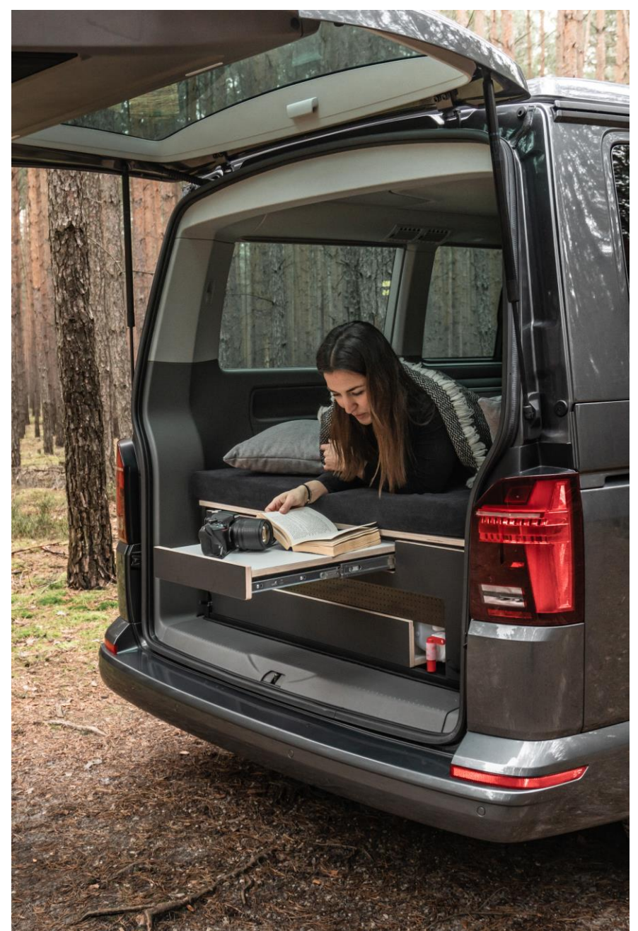
Bsp. VISU Moie