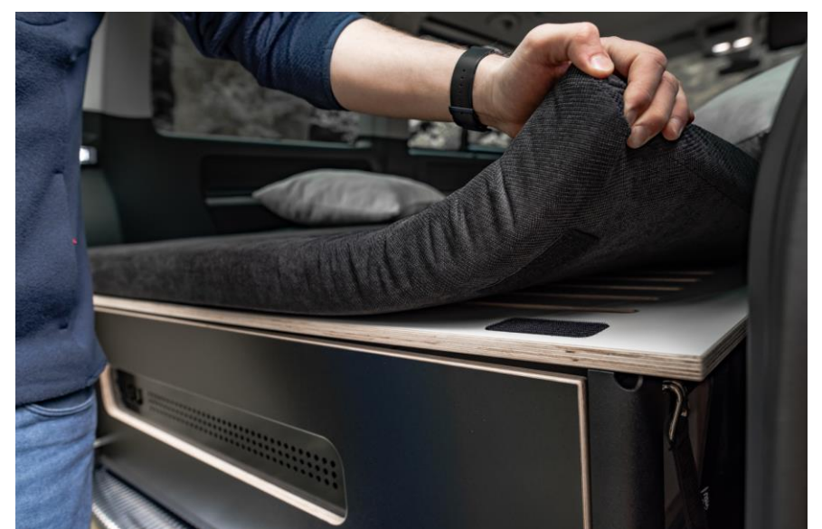
Bsp. VISU Moie

Die Grundlage für einen erholsamen Schlaf, ist eine qualitative Matratze. Ein 7 cm dickes Sandwich aus recyceltem Hartschaum und Kaltschaum sorgt für stabilen Halt und Komfort. Und das ganze kombiniert mit einem langlebigen Bezug (Martindale 100.000 Zyklen) mit niedrigem Flor, der leicht zu reinigen ist.