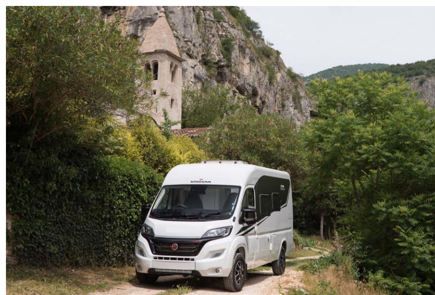
Bsp. CITY PRO