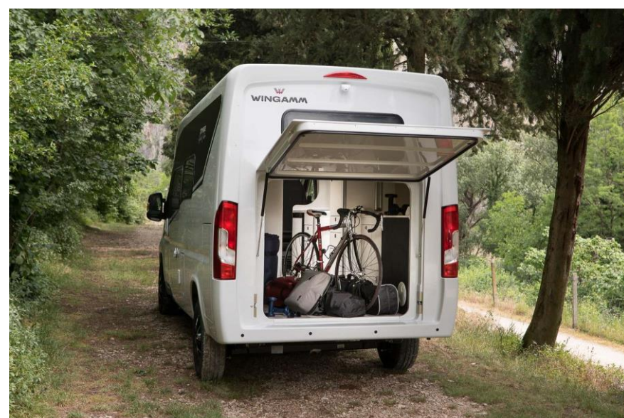
Bsp. CITY PRO