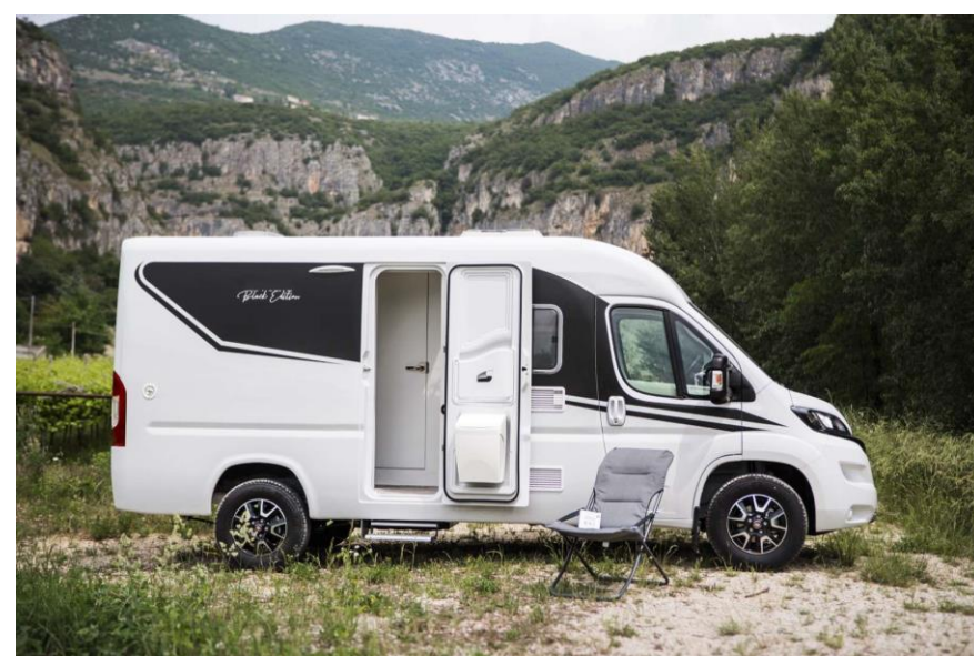
Bsp. CITY PRO