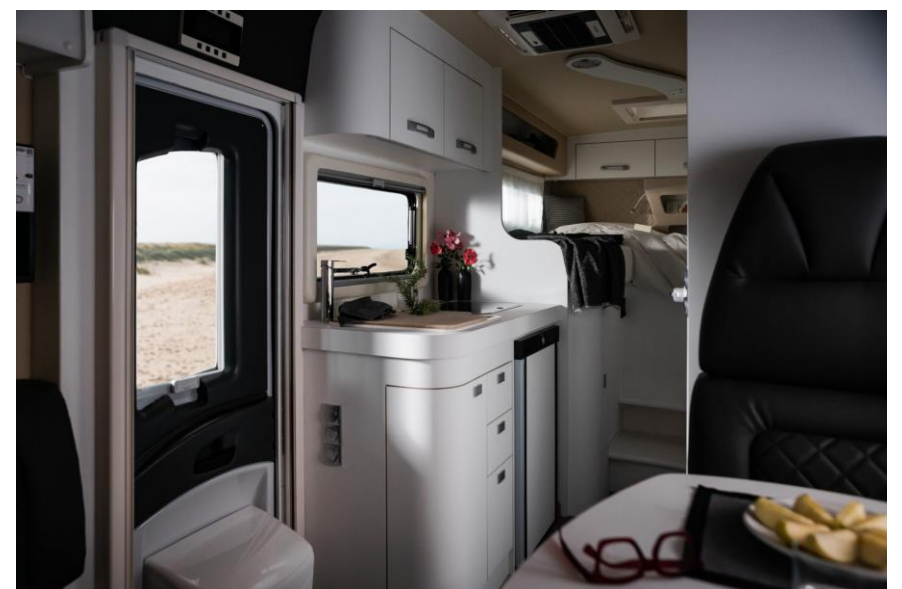
Bsp. Design „Metropoli“