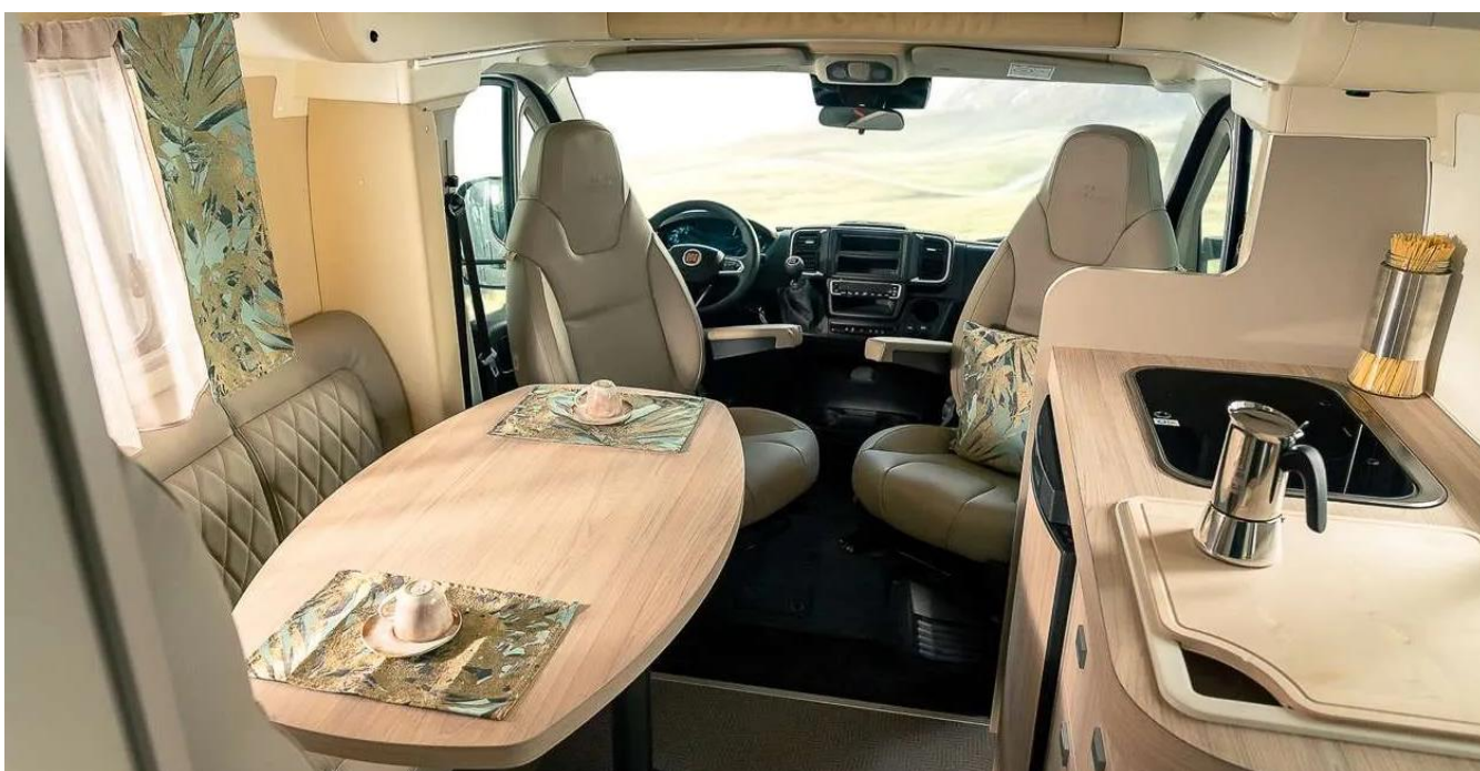
Bsp. Design „Dolomiti“

Wälder, atemberaubende Ausblicke, Himmel und Felsen, die verschmelzen und Ruhe und Entspannung schenken. Die „Dolomiti-Stimmung“ lässt uns in die Farben der Natur eintauchen: sanfte Farbtöne wie Grün und Beige in Materialien mit Holz- und Leinenstruktur. Für die Möbel wurden Laminat in Ulmenholz-Struktur verwendet (ARPA und KAINDL). Die Sitzgelegenheiten wurden aus hochwertigem taupefarbigem Kunstlederstoff hergestellt, ergänzt um feine Dekostoffe für Vorhänge und Kissen von Rubelli.