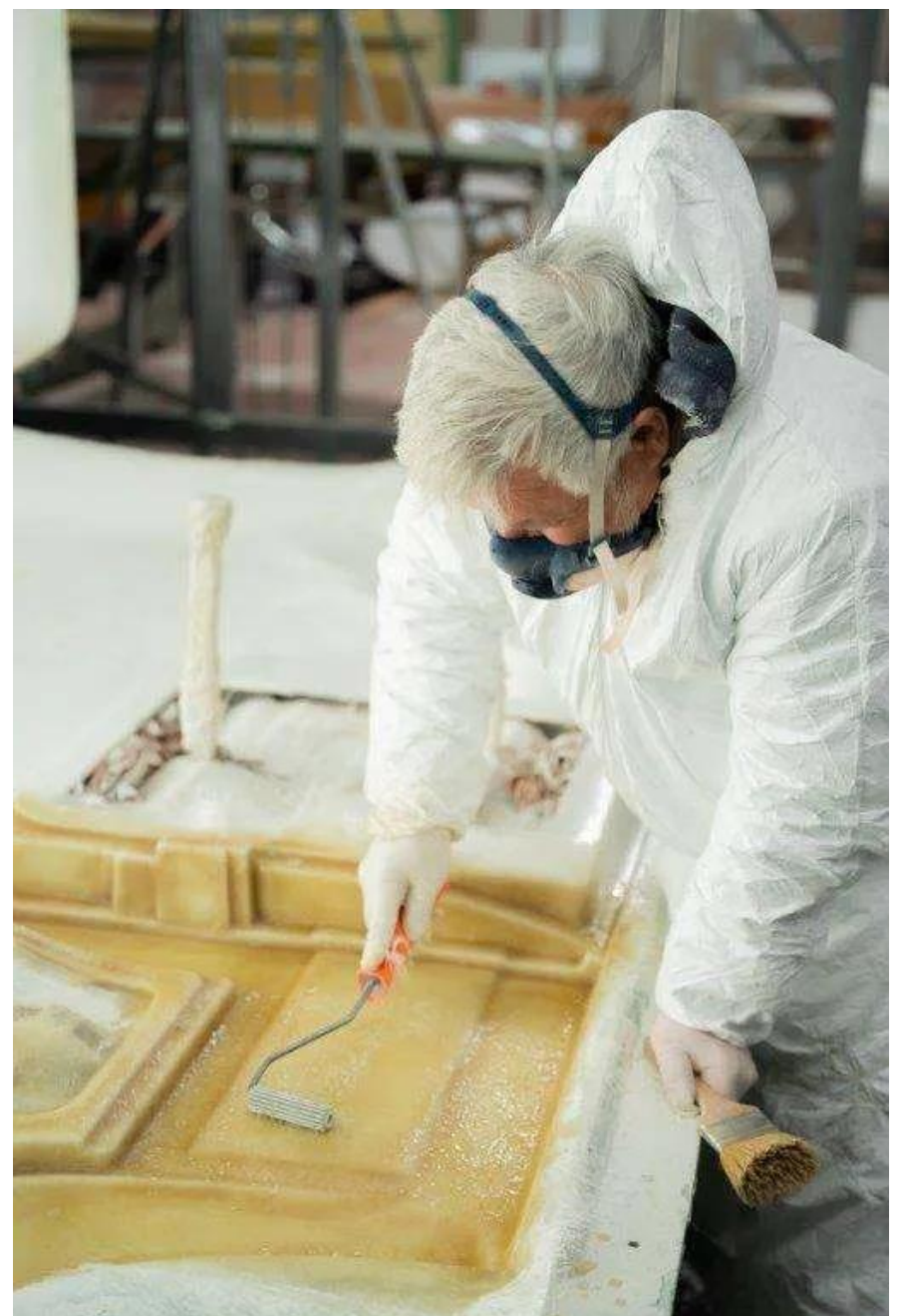
Bsp. Produktion Monocock-Aufbau