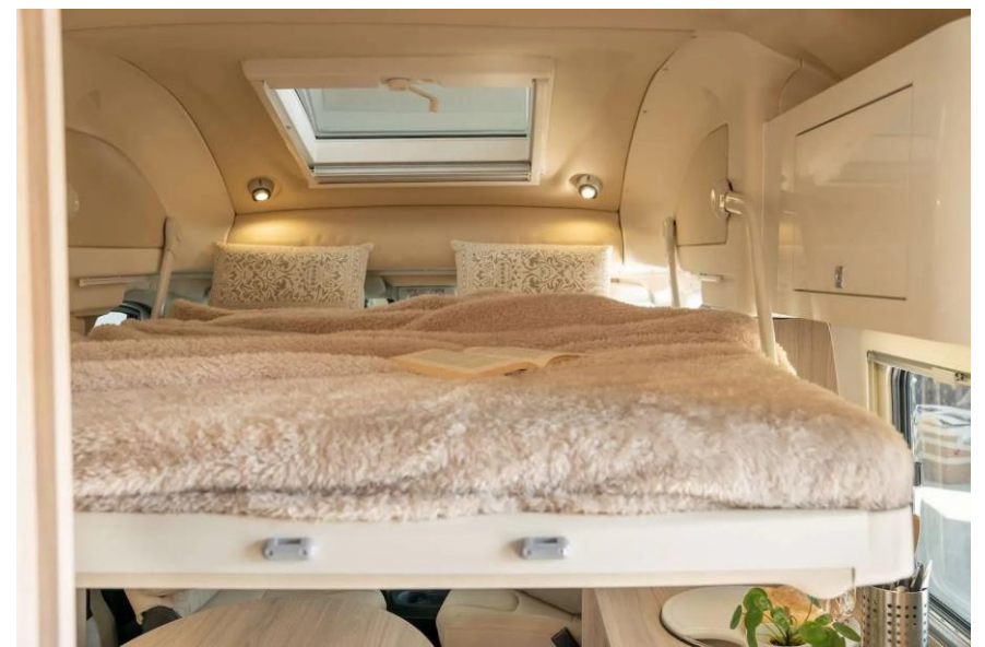
Bsp. Klapp-Bett mit Hebesystem