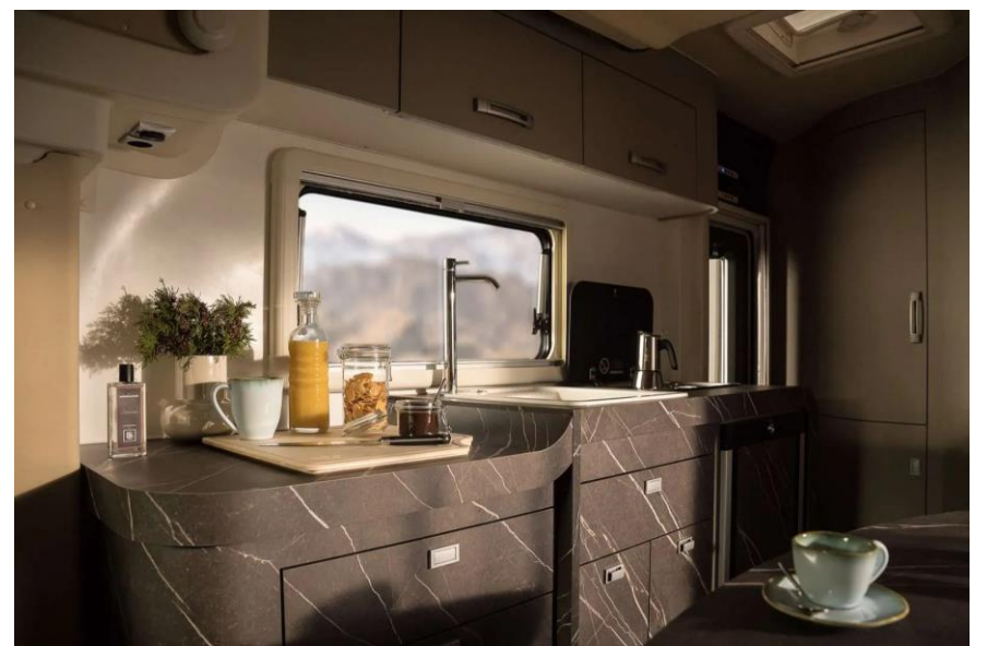
Bsp. Design „Costiera“