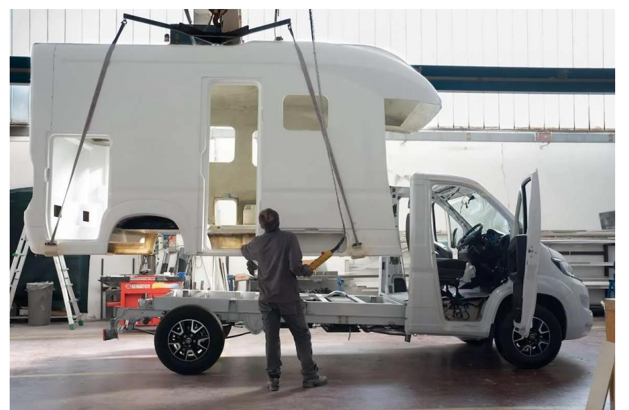
Bsp. Aufsetzen des Monocock