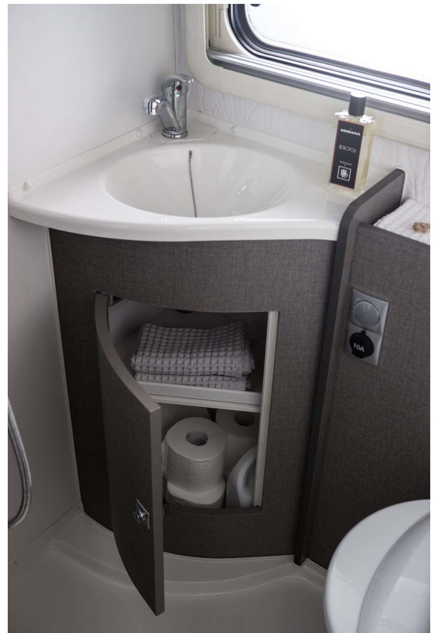
Bsp. Bad / Toilette City Pro