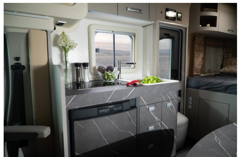
Bsp. Wingamm OASI 610 M