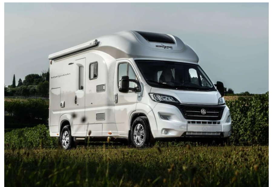
Bsp. OASI 610 GL