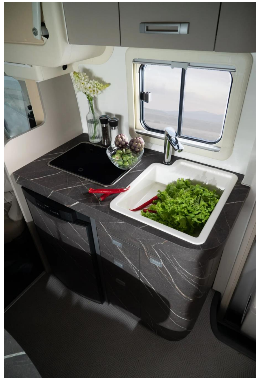
Bsp. OASI 610 Küchenblock