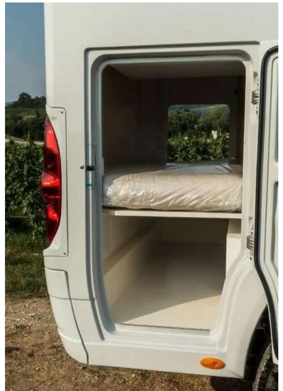
Bsp. OASI 610 ST