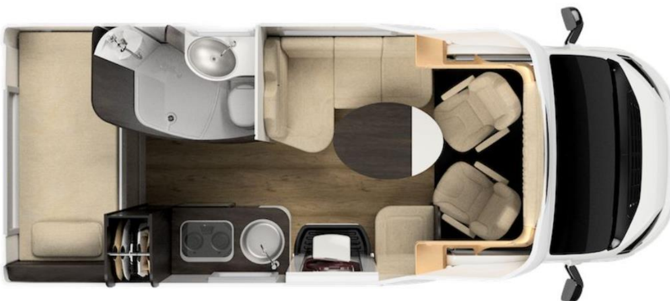
Bsp. OASI 610 ST