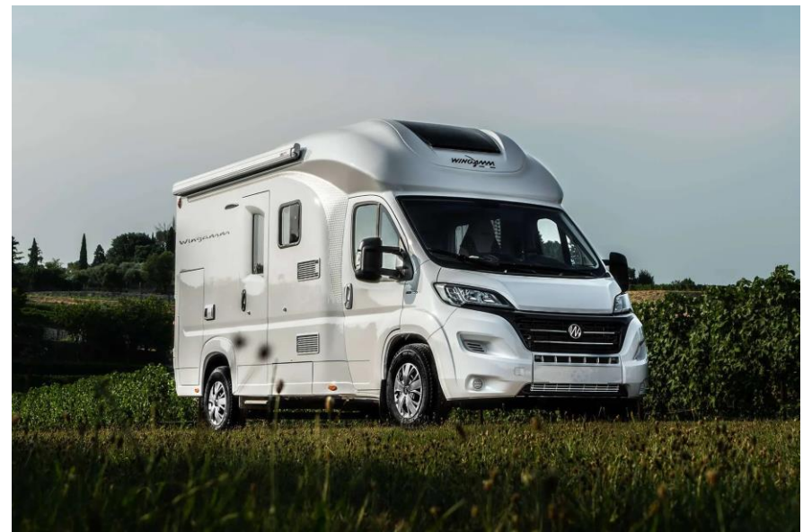
Bsp. OASI 610 ST