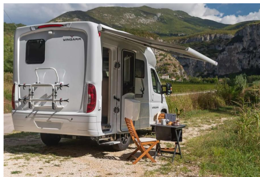
Bsp. OASI 540.1