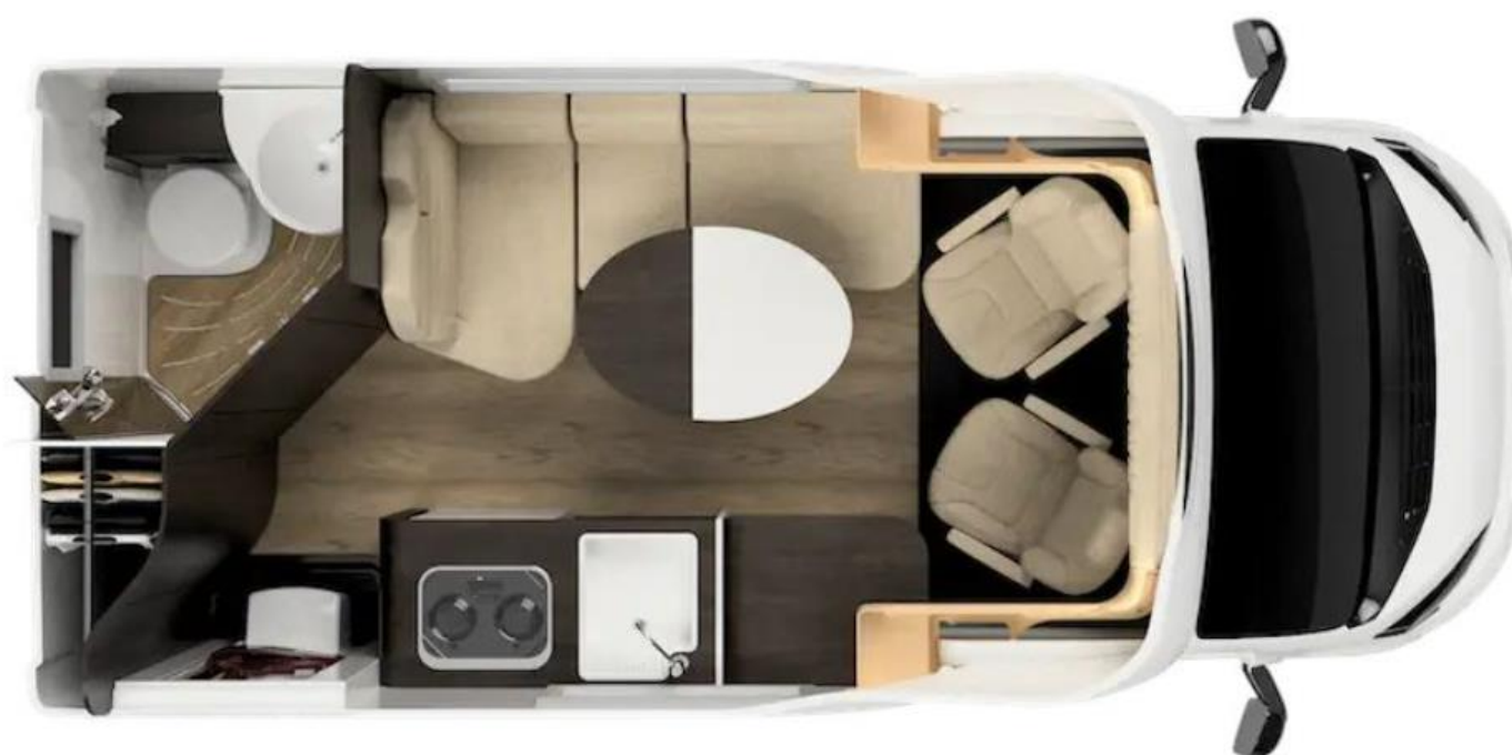
Bsp. OASI 540.1