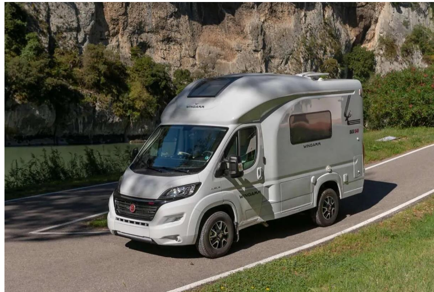
Bsp. OASI 540.1