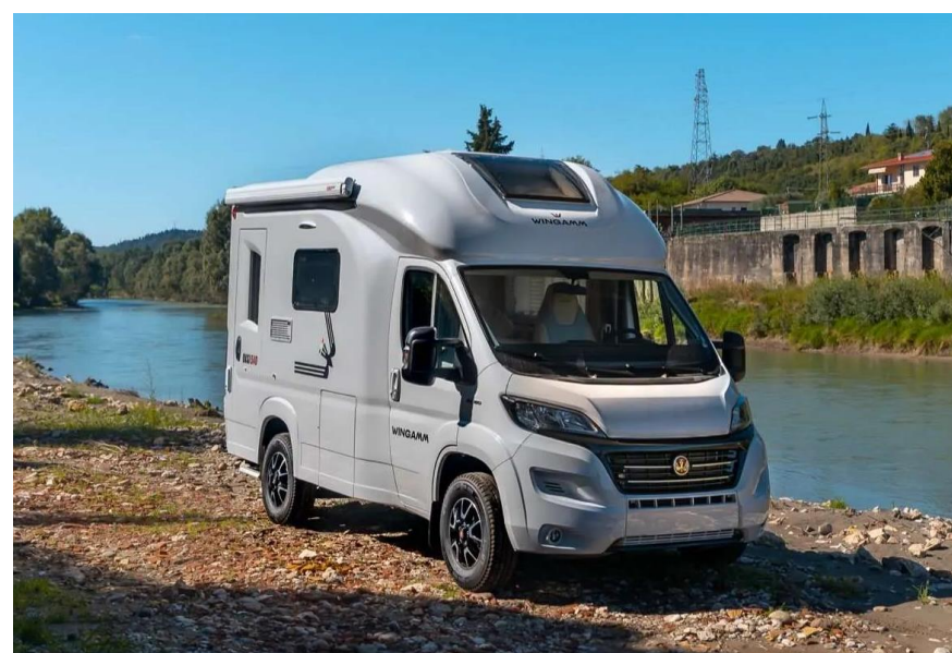
Bsp. OASI 540.1