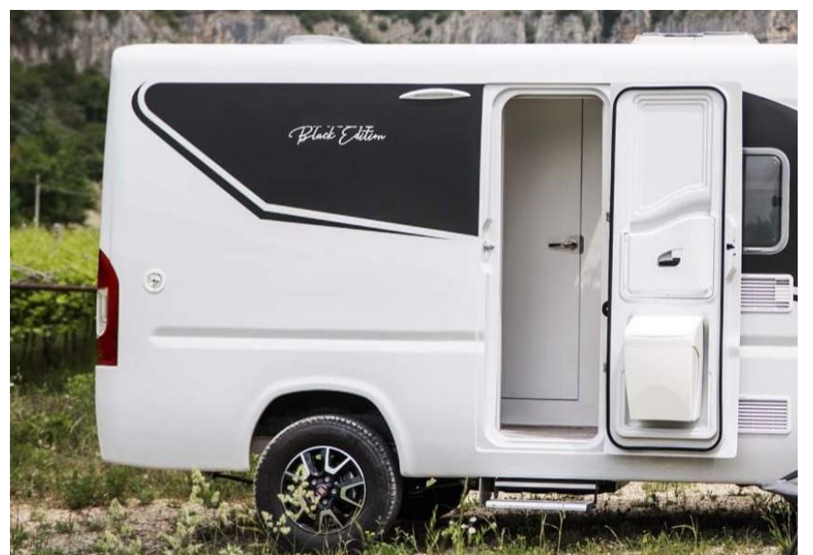
Bsp. Ergonomische Tür