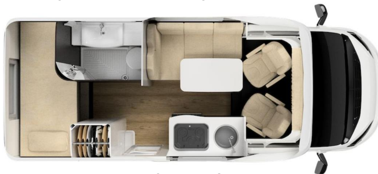
Bsp. BROWNIE 5.8 GL