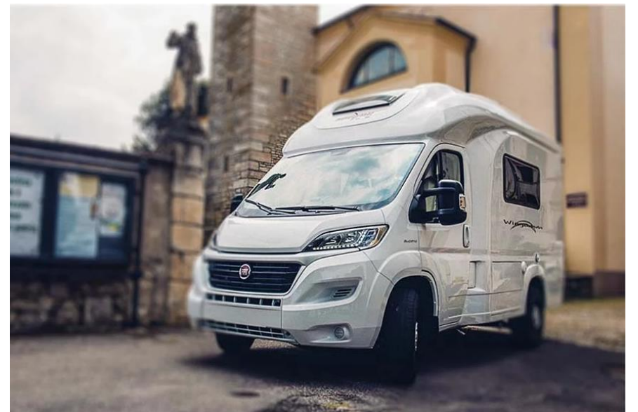
Bsp. BROWNIE 5.8 GL